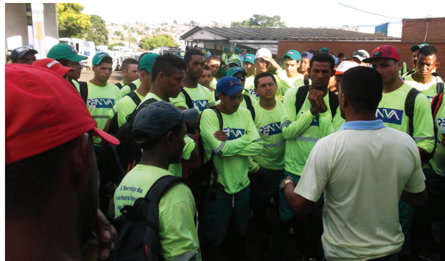
Trabalhadores cruzam os braços e cobram o recebimento de Horas Extras.

Na varrição, os trabalhadores reclamaram que o novo uniforme entregue pela Renova é desconfortável para o trabalho. O Sindicato realizou assembléia com os trabalhadores para ouvir as reclamações. A empresa foi cobrada e se comprometeu a trocar os uniformes nos próximos dias.