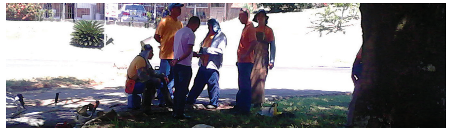
Trabalhadores e Sindicato reunidos para cobrar segurança no trabalho.