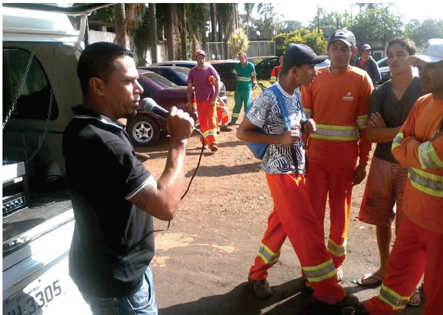
Sindicato acompanhando a manifestação dos trabalhadores.

Os trabalhadores da Agreg denunciaram e o Sindicato constatou diversas irregularidades cometidas pela empresa. Falta de EPI, más condições nos banheiros e vestiários, caminhões danificados e faltando equipamentos adequados para o serviço. Todos esses problemas estavam colocando em risco a segurança e a saúde do trabalhador. Diante de tantas coisas erradas, os trabalhadores cruzaram os braços e juntamente com o sindicato pressionou a Agreg para resolver os problemas. Ao final da manifestação, a vitória mais uma vez foi conquistada e os problemas foram resolvidos.