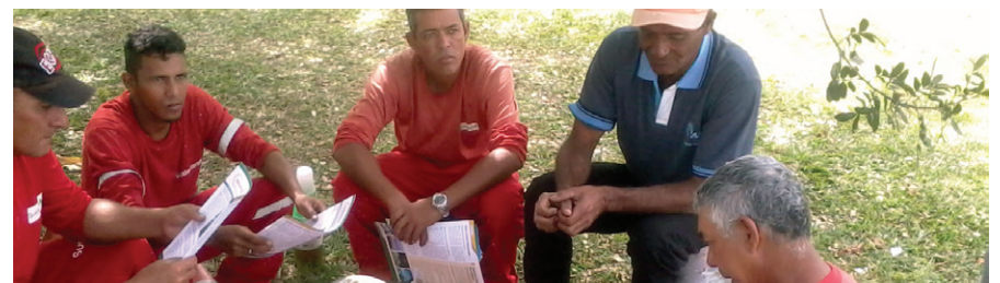
União dos trabalhadores para cobrar melhorias.