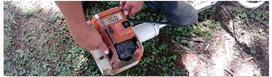
Equipamento de trabalho em más condições.

Na Eppo em Jaguariúna o Sindicato flagrou falta de segurança para os trabalhadores dos serviços gerais. A equipe de trabalho paralisou e cobrou melhorias na segurança e também a troca dos equipamentos de trabalho que estavam em más condições colocando em risco a saúde e segurança dos trabalhadores.