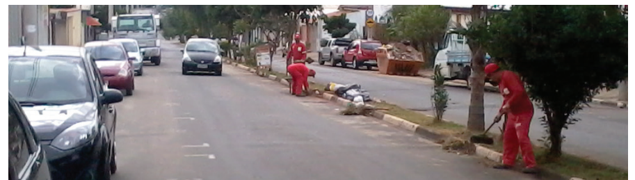
Trabalhadores sem proteção no trânsito.

Durante fiscalização, o Sindicato flagrou trabalhadores dos serviços gerais trabalhando sem a empresa fornecer os cones de sinalização e banheiros químicos. Após união dos trabalhadores e a atuação firme do sindicato, a empresa Sustentare resolveu os problemas.