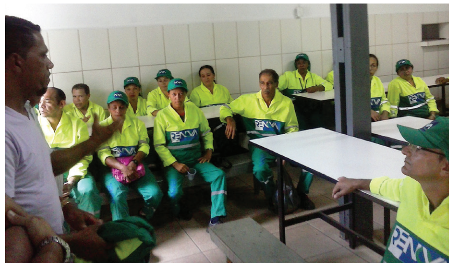
Assembleia do Sindicato com os trabalhadores para cobrar a troca do uniforme.

Na varrição, os trabalhadores reclamaram que o novo uniforme entregue pela Renova é desconfortável para o trabalho. O Sindicato realizou assembléia com os trabalhadores para ouvir as reclamações. A empresa foi cobrada e se comprometeu a trocar os uniformes nos próximos dias.