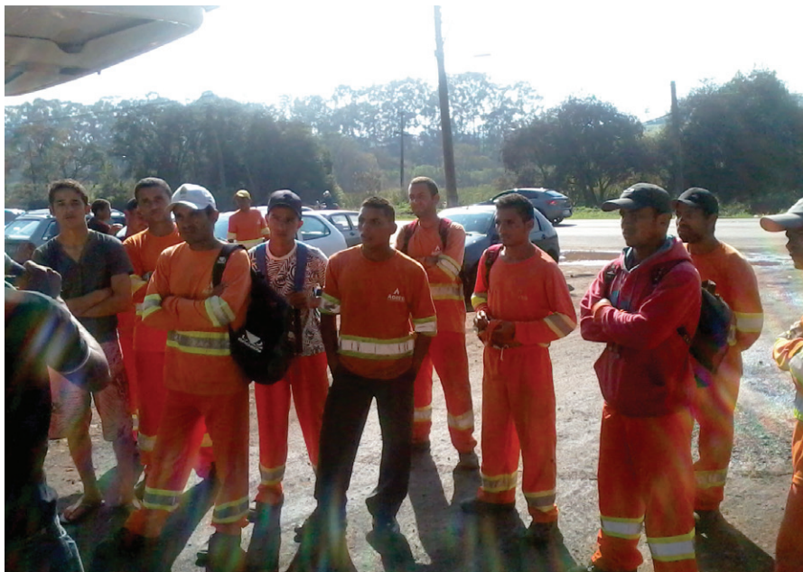
Trabalhadores reivindicam melhorias.